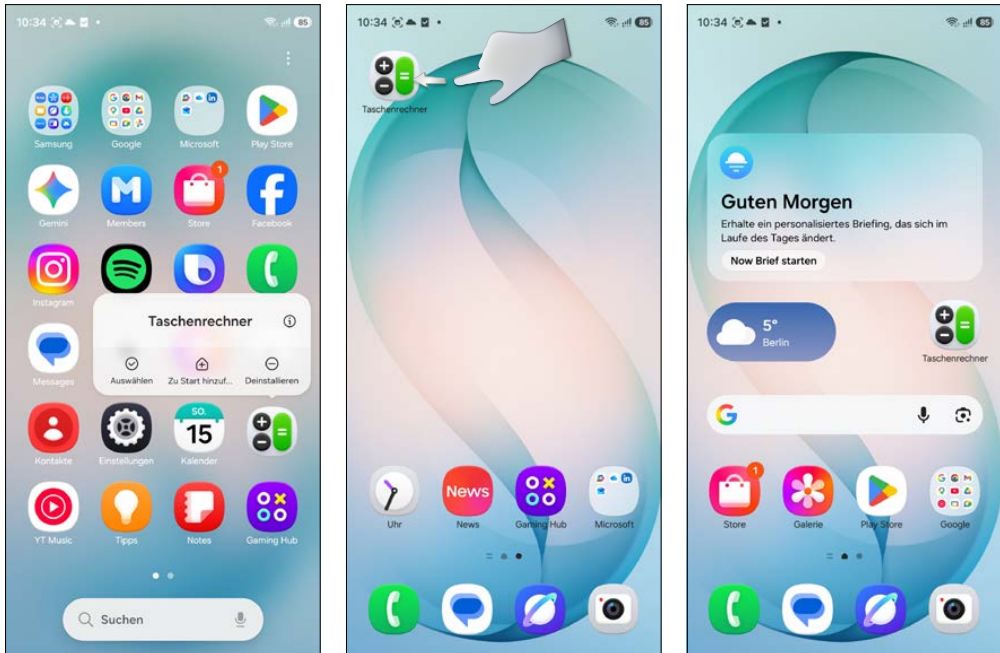
App aus der App-Liste auf dem Startbildschirm ablegen und verschieben

Am linken Bildschirmrand der zweiten Startbildschirmseite erscheint beim Verschieben eines App-Symbols der angedeutete Rand der ersten Startbildschirmseite. Schieben Sie ein App-Symbol über den Rand hinaus, wird die App auf die erste Seite verschoben. Genauso können Sie eine App nach rechts über den Rand schieben. Dann wird eine neue Startbildschirmseite angelegt, auf der Sie diese App platzieren können. Es ist auch möglich, eine App direkt aus der App-Liste an die gewünschte Position auf dem Startbildschirm zu ziehen.