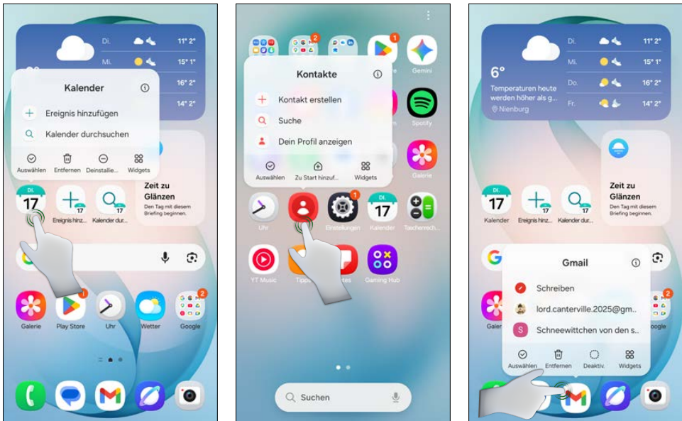
App-Shortcuts nutzen und auf den Startbildschirm legen, Mitte: App-Shortcuts auf dem App-Bildschirm, rechts: auch Symbole der Schnellstartleiste unterstützen App-Shortcuts