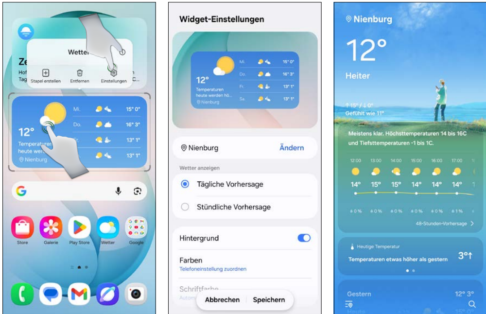
Wetter-Widget auf dem Startbildschirm hinzufügen

Tippen Sie auf das Wetter-Widget auf dem Startbildschirm, öffnet sich eine App mit den aktuellen Wetterdaten. Weiter unten in der Wetteransicht finden Sie die Zeiten für Sonnenauf- und -untergang, Windgeschwindigkeit, Windrichtung, Luftfeuchtigkeit sowie Daten zur Luftqualität. Weitere Informationen zur Wetter -App finden Sie in Kapitel 8.