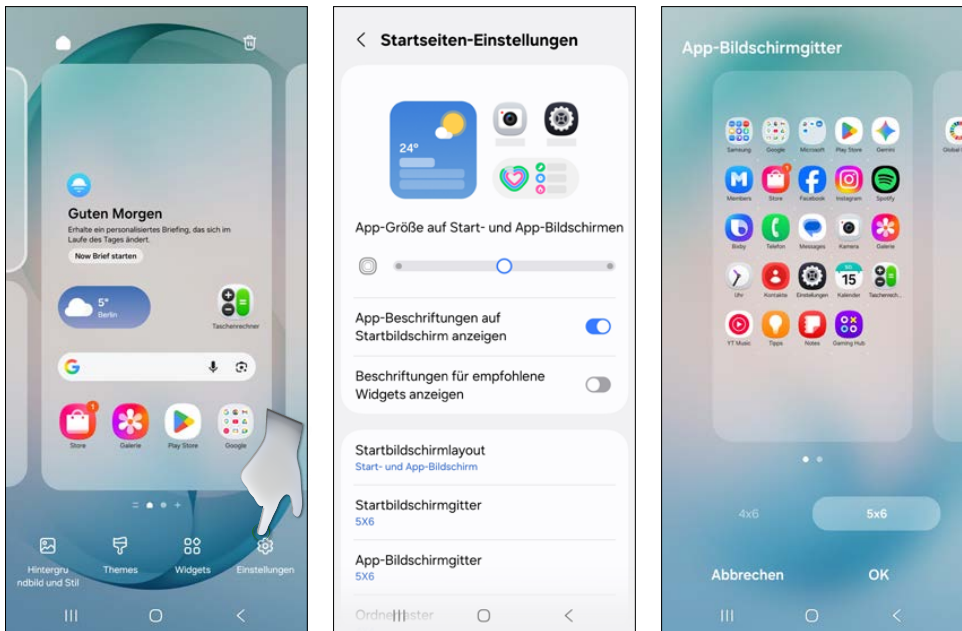
Bildschirmgitter auf dem Startbildschirm und App-Bildschirm verändern, um mehr Apps anzuzeigen