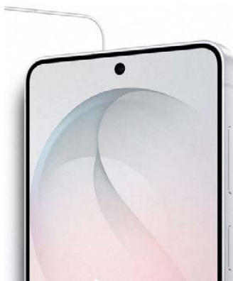
Die Tasten auf dem Samsung Galaxy S26

Das Samsung Galaxy S26 verfügt über insgesamt drei mechanische Tasten, obwohl in den meisten Fällen die Bedienung ausschließlich über den Touchscreen erfolgt.